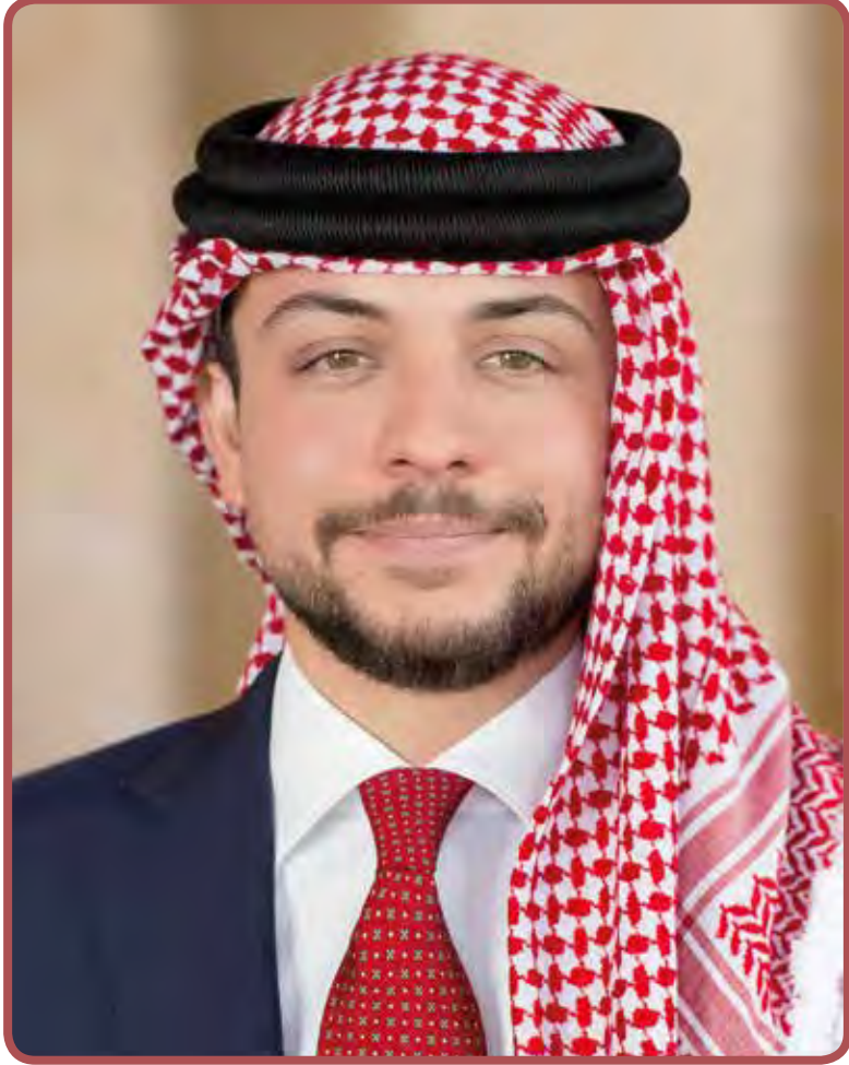
صاحب السمو الملكي الأمير الحسين بن عبدالله الثاني ولي العهد المعظم