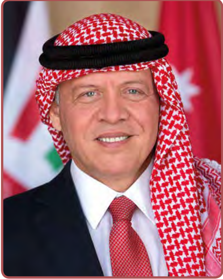
حضرة صاحب الجلالة الهاشمية الملك عبدالله الثاني بن الحسين المعظم _ حفظه الله ورعاه _